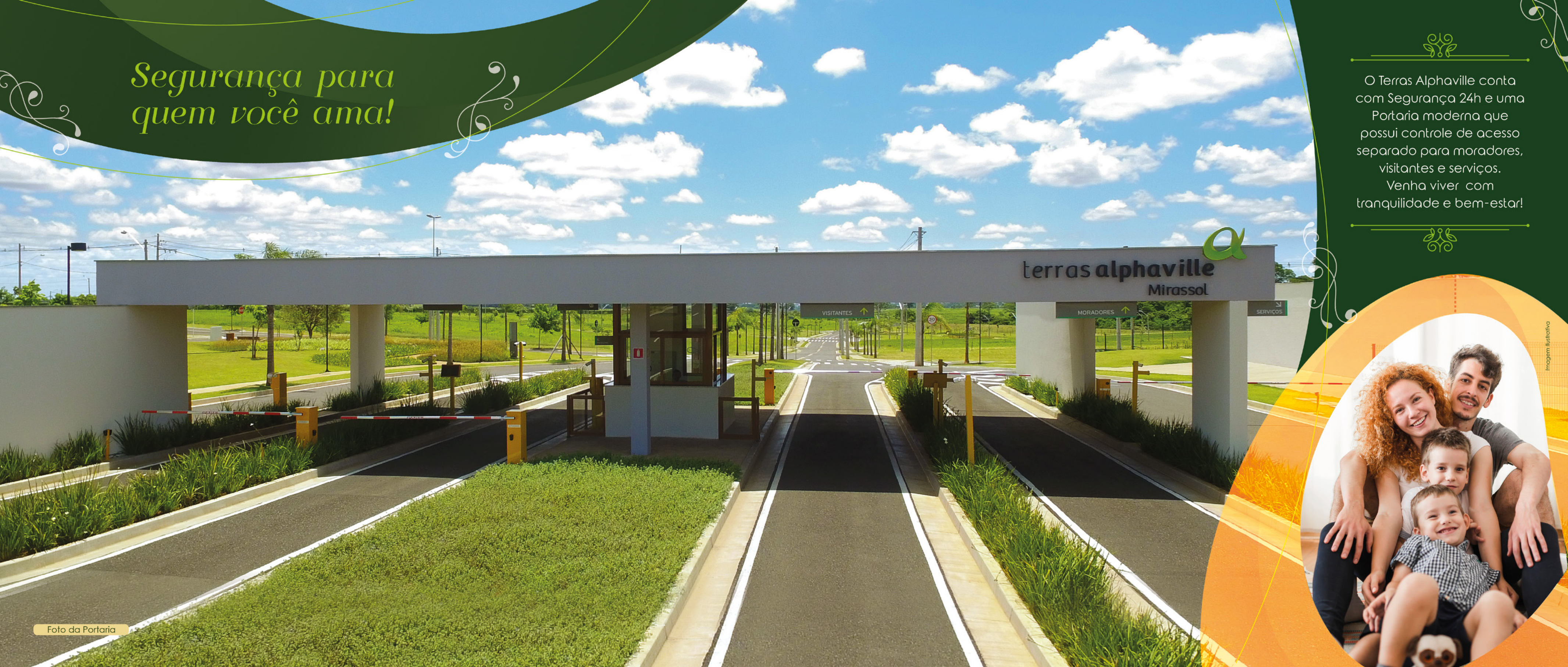
Foto da Portaria

O Terras Alphaville conta com Segurança 24h e uma Portaria moderna que possui controle de acesso separado para moradores, visitantes e serviços. Venha viver com tranquilidade e bem-estar!