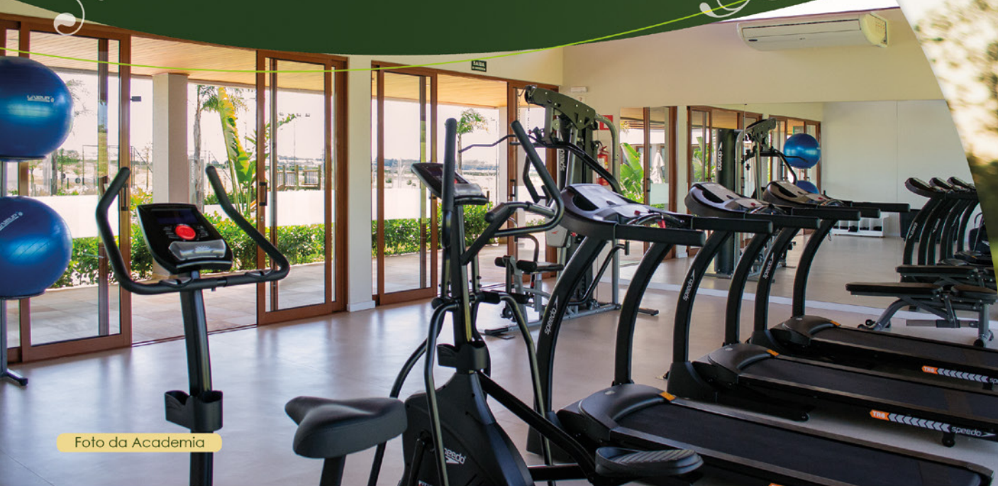
Foto da Academia