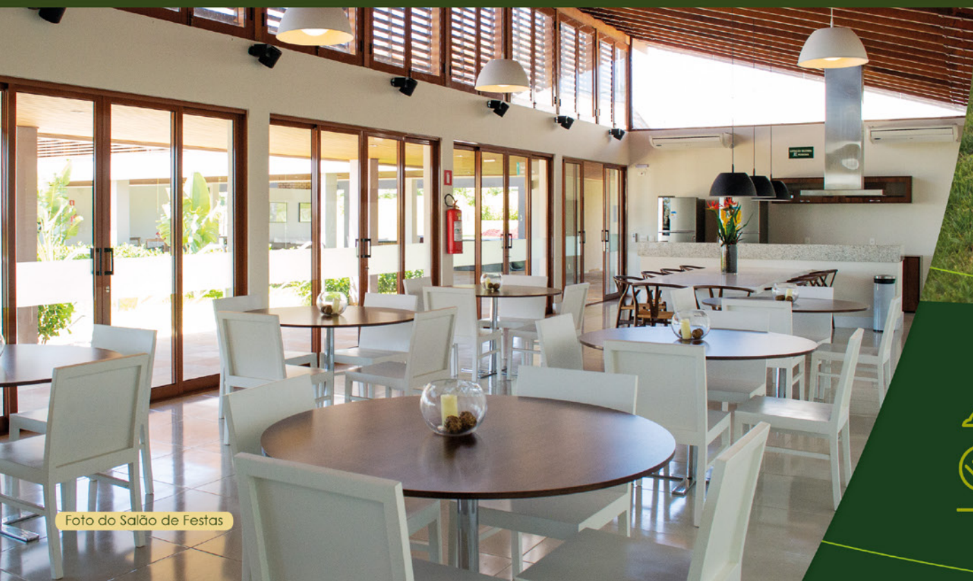
Foto do Salão de Festas