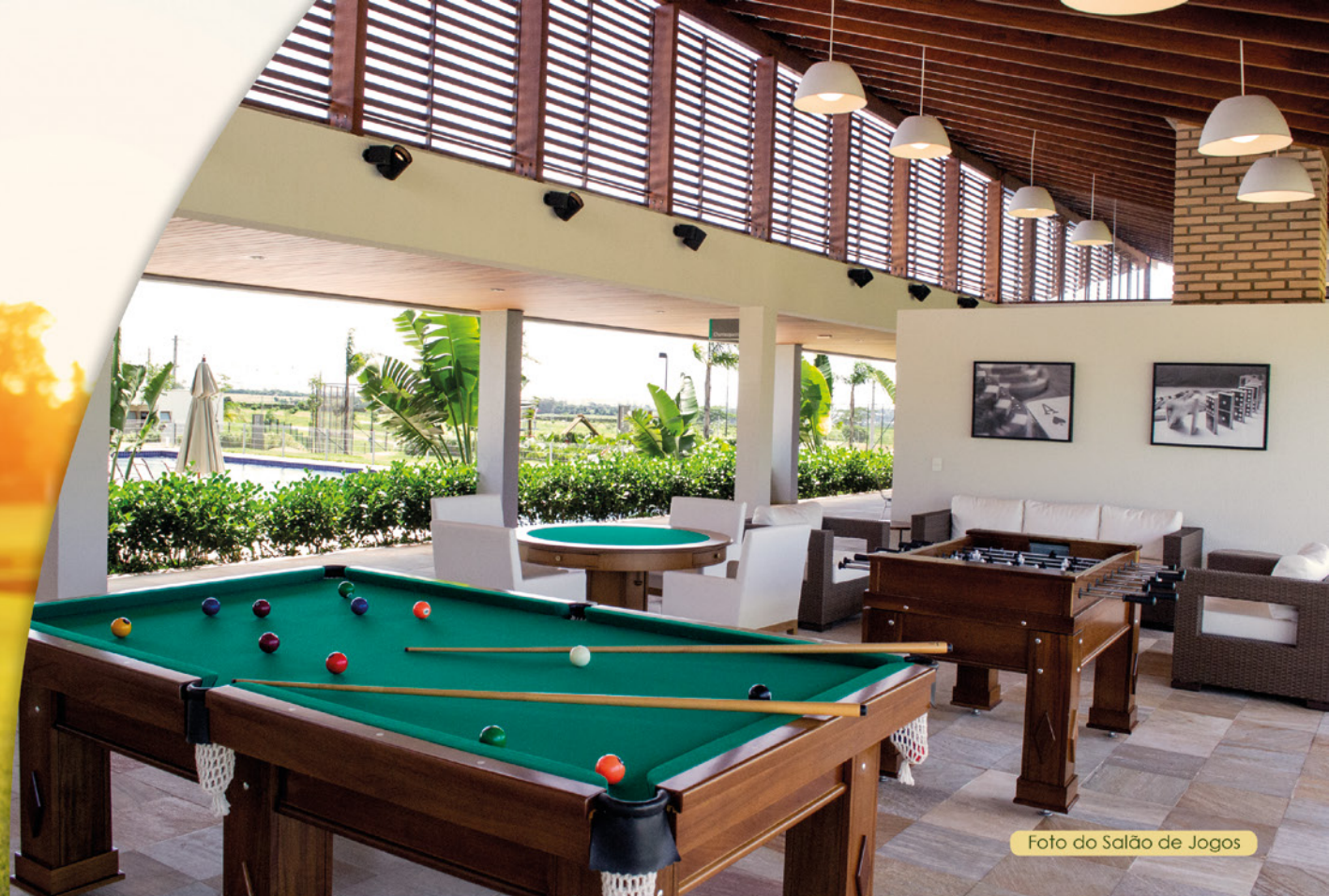
Foto do Salão de Jogos