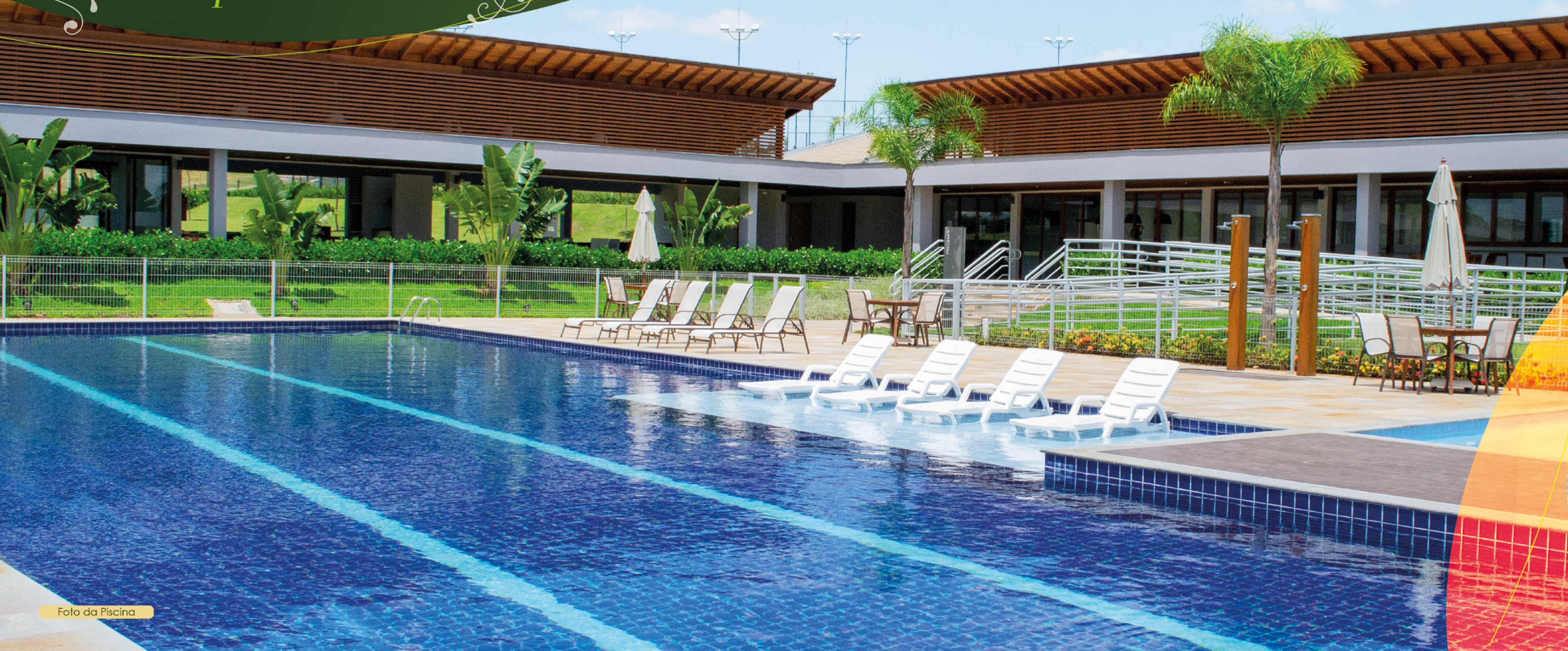
Foto da Piscina

O Terras Alphaville traz a oportunidade para você viver em um lugar tranquilo, com muita segurança em uma área de lazer incrível.