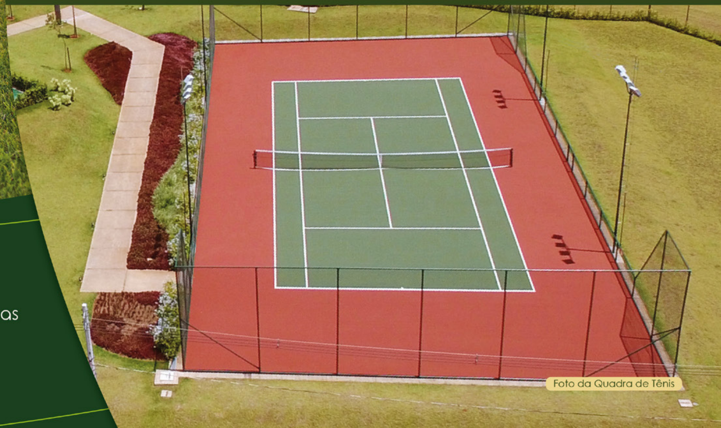
Foto da Quadra de Tênis