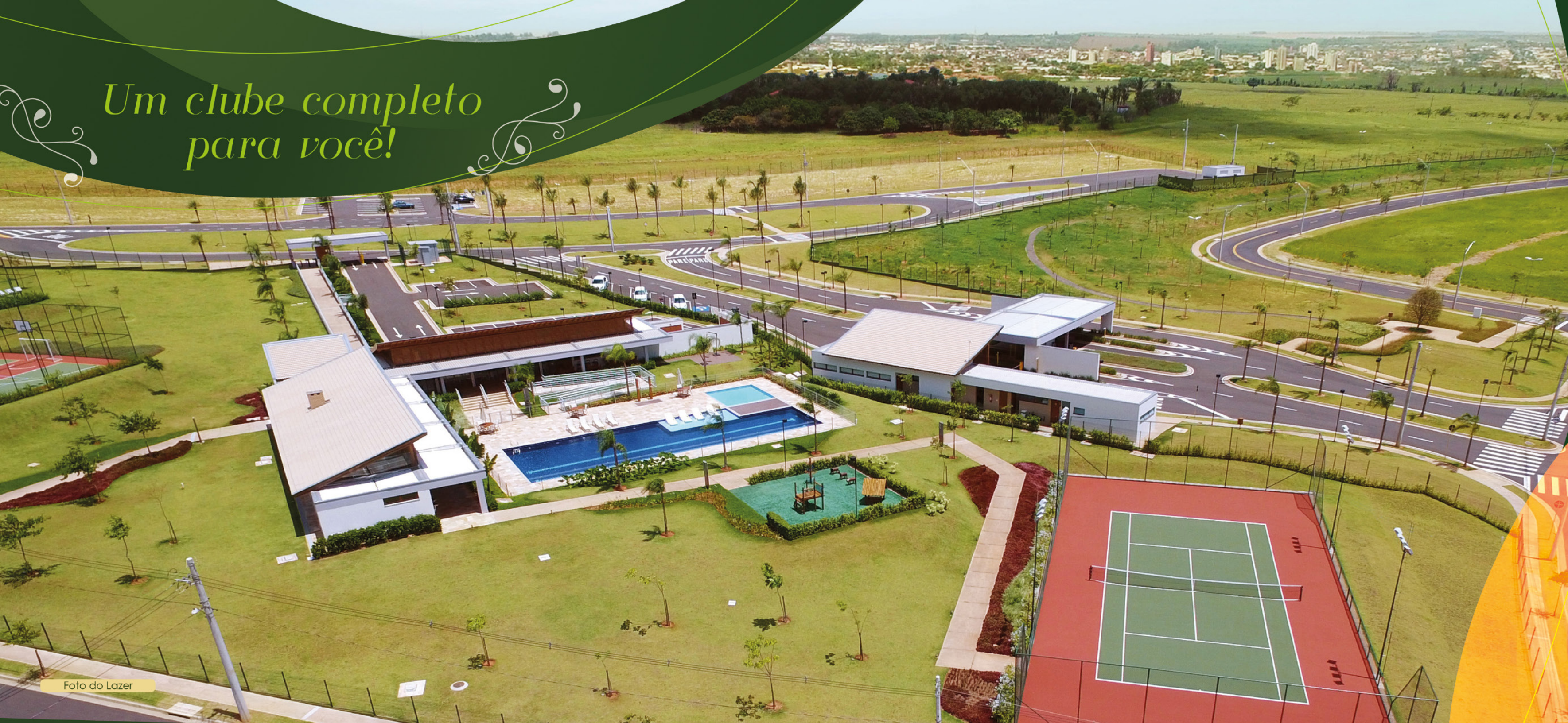
Foto do Lazer

O Lazer aqui é para todos se movimentarem e se divertirem. São mais de 7 mil m 2 com opções para todas as idades e estilos. Um convite para ser mais ativo e saudável!