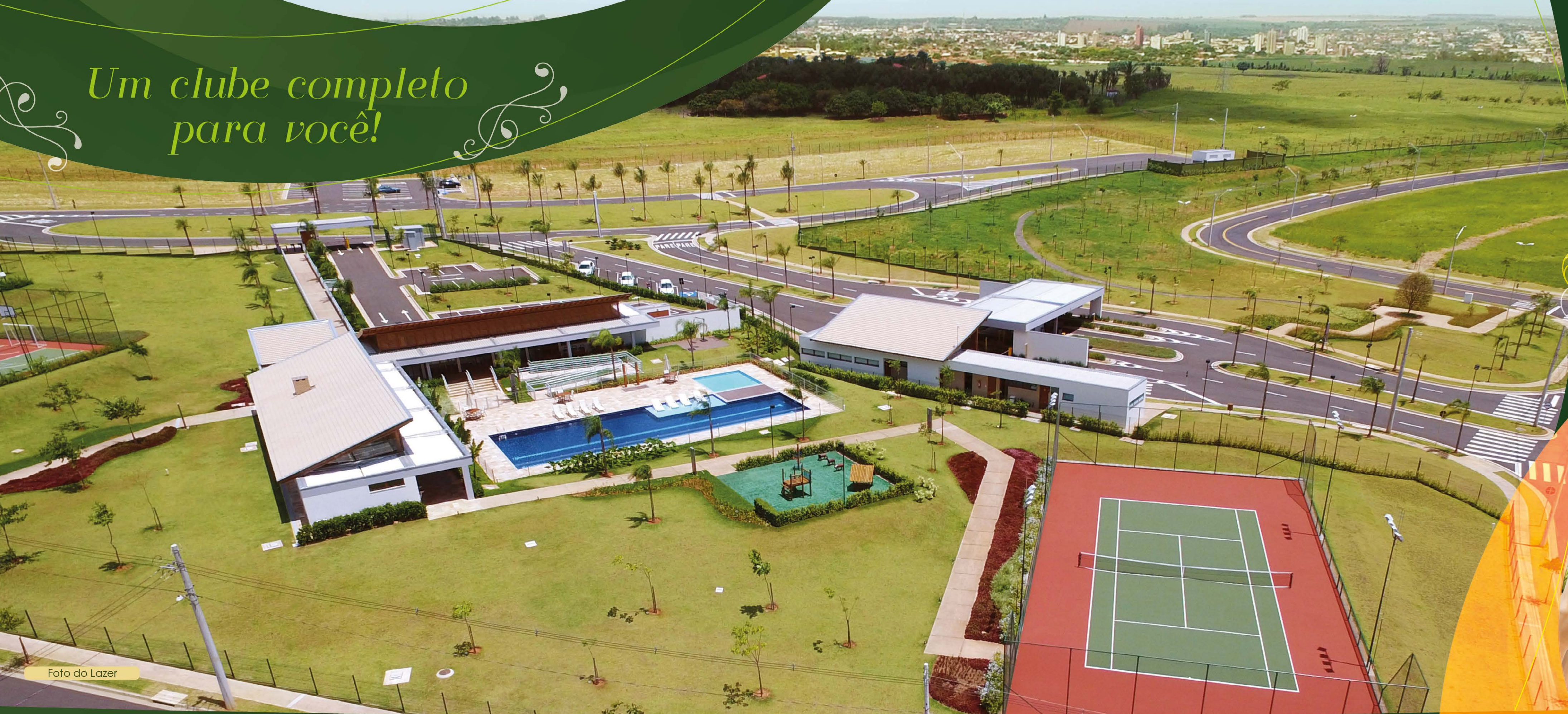
Foto do Lazer

O Lazer aqui é para todos se movimentarem e se divertirem. São mais de 7 mil m 2 com opções para todas as idades e estilos. Um convite para ser mais ativo e saudável!