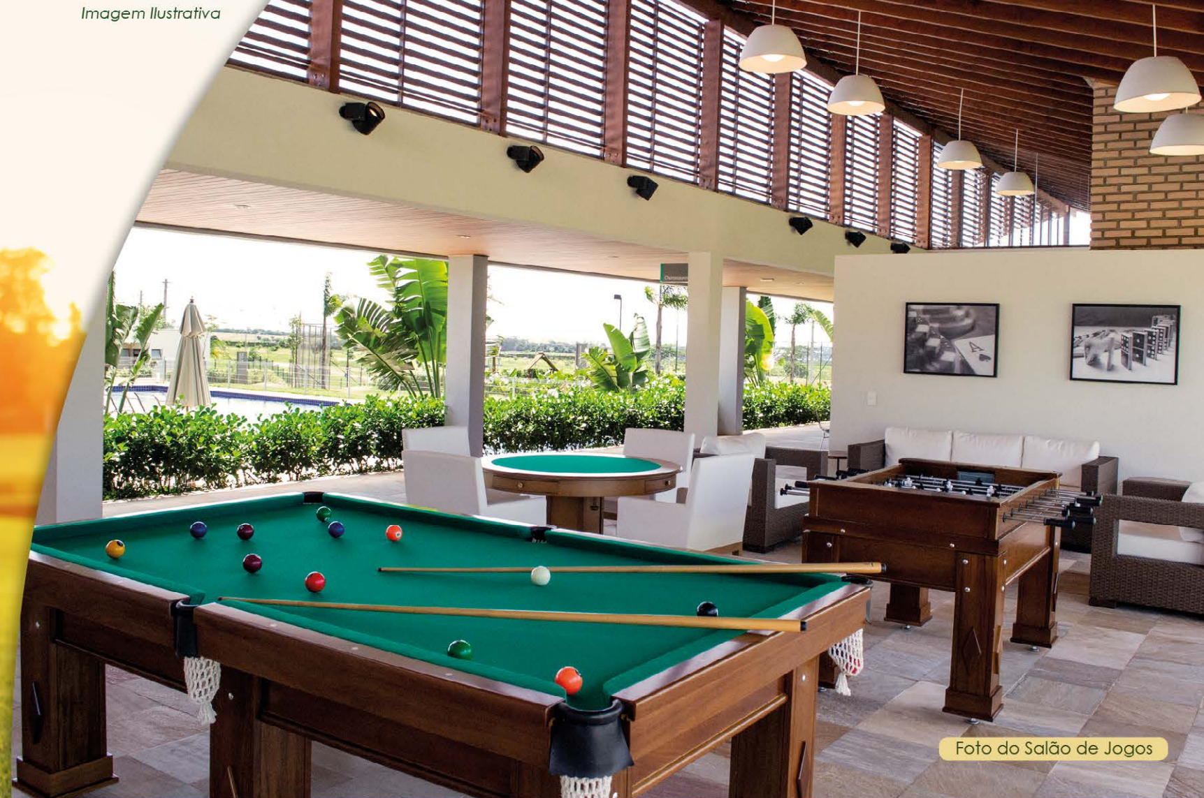
Foto do Salão de Jogos