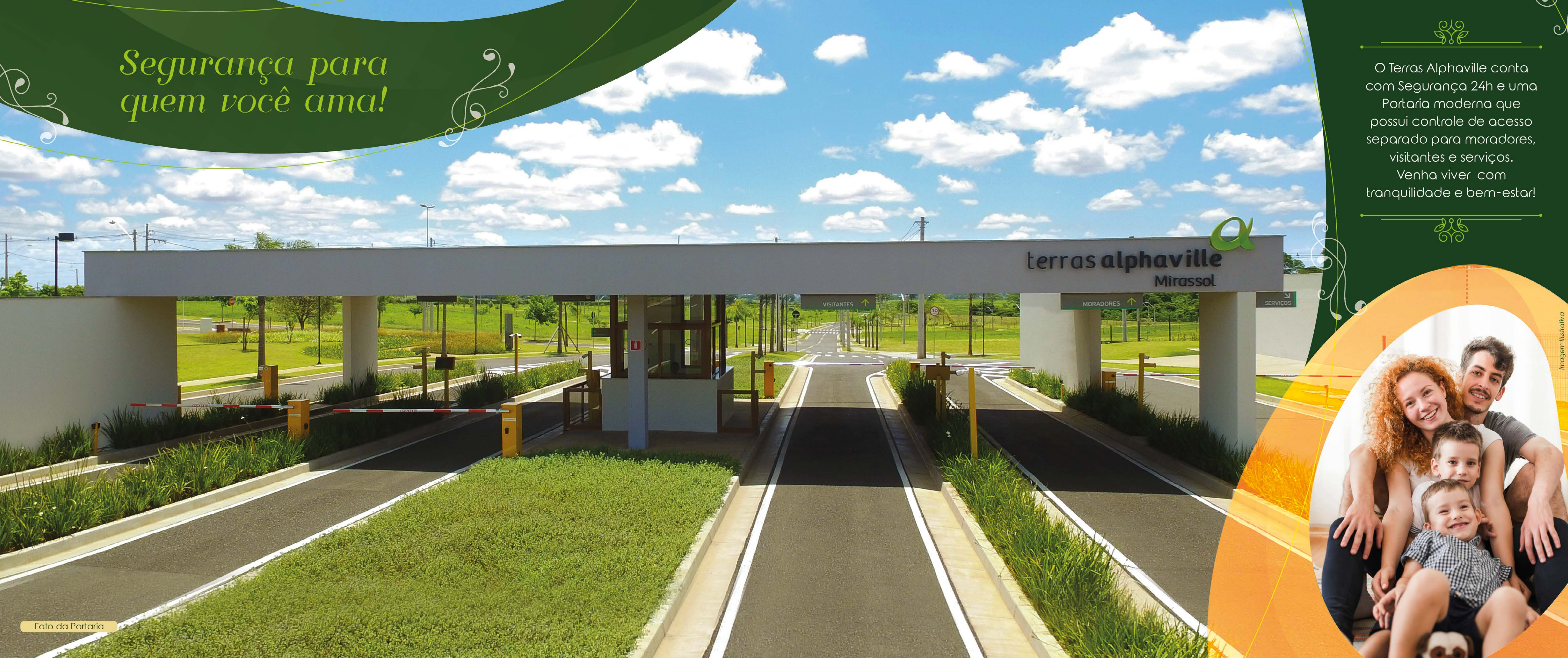
Foto da Portaria

O Terras Alphaville conta com Segurança 24h e uma Portaria moderna que possui controle de acesso separado para moradores, visitantes e serviços. Venha viver com tranquilidade e bem-estar!