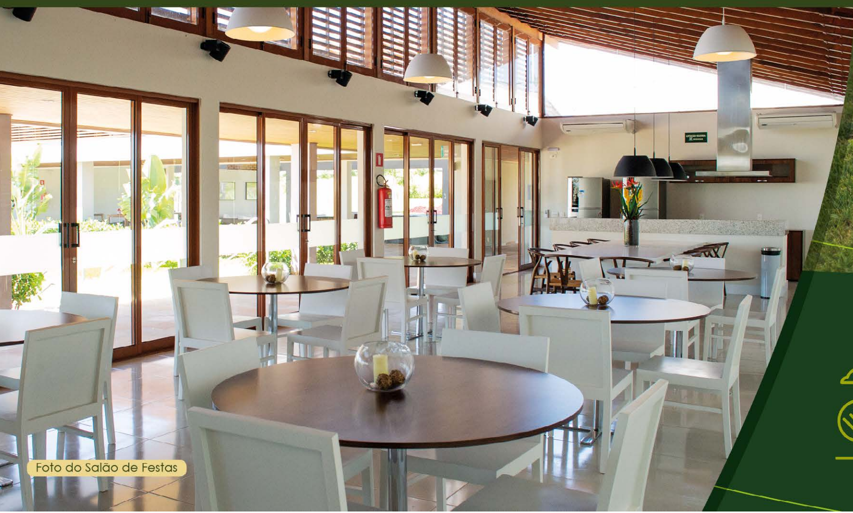
Foto do Salão de Festas