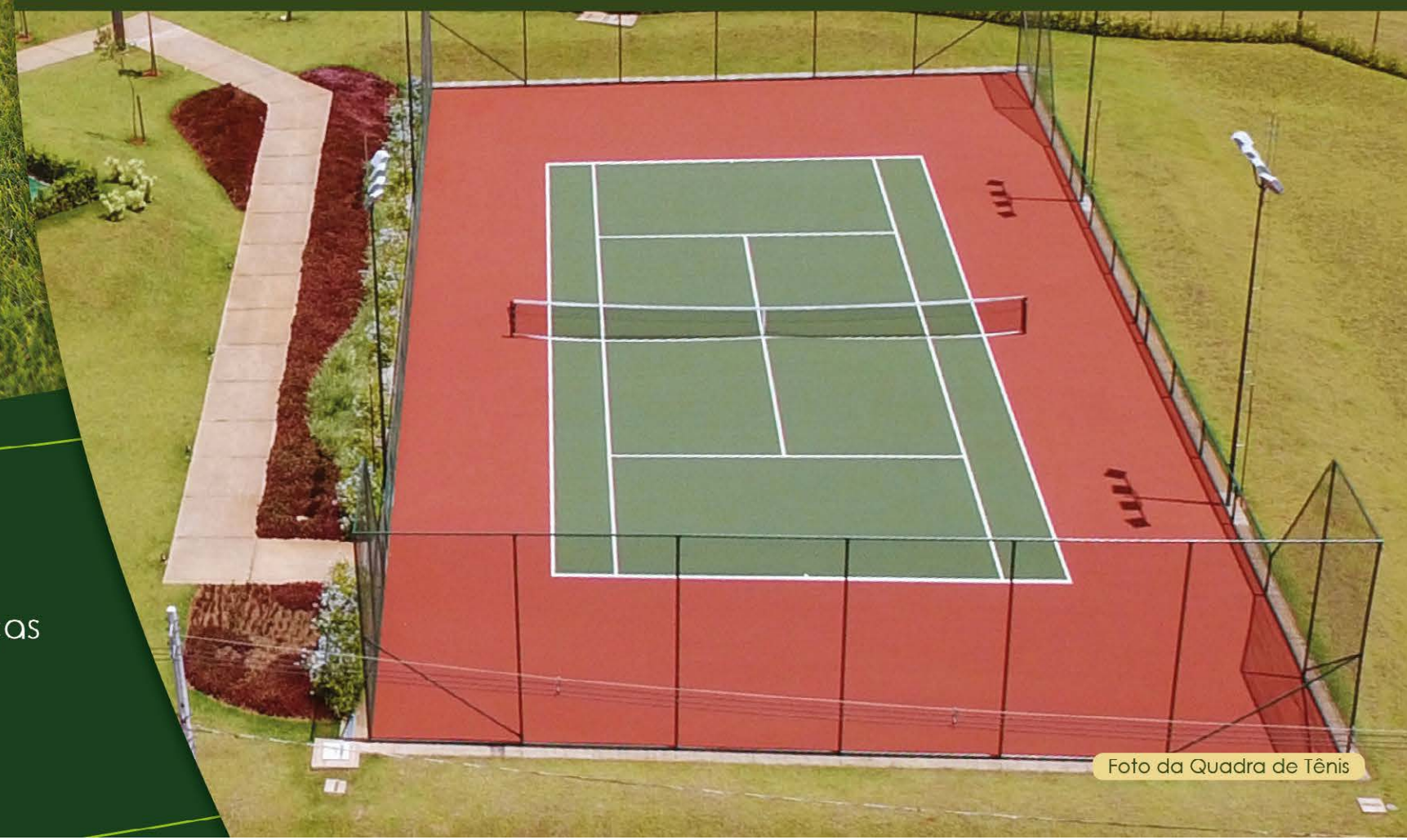
Foto da Quadra de Tênis