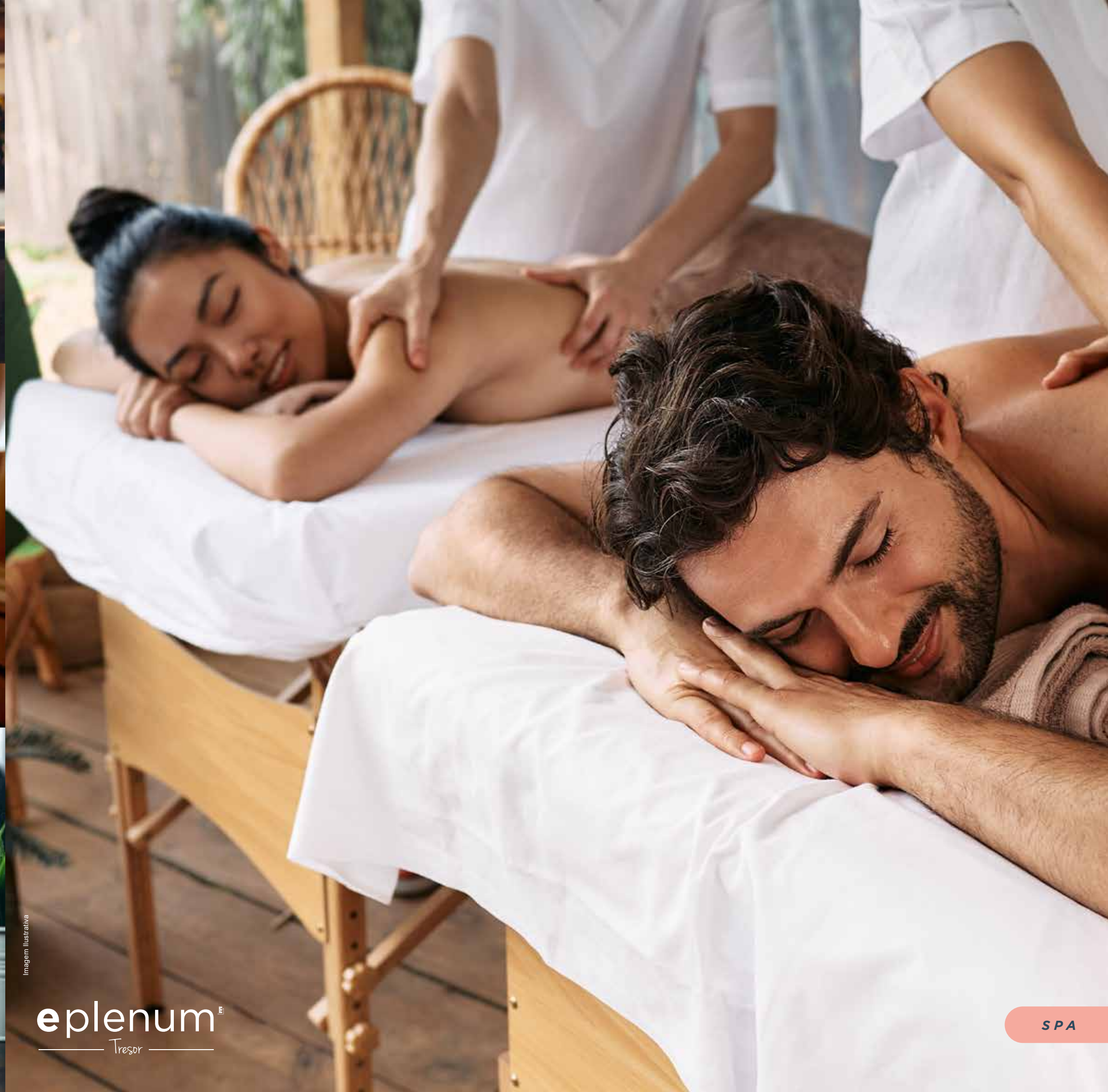
eplenum ™ — Tresor —