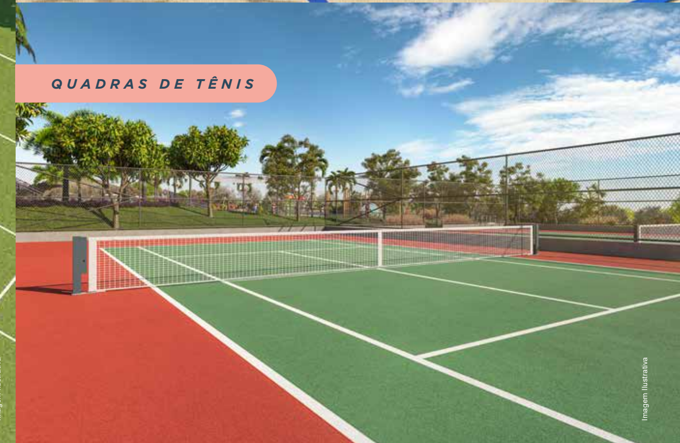
QUADRAS DE TÊNIS