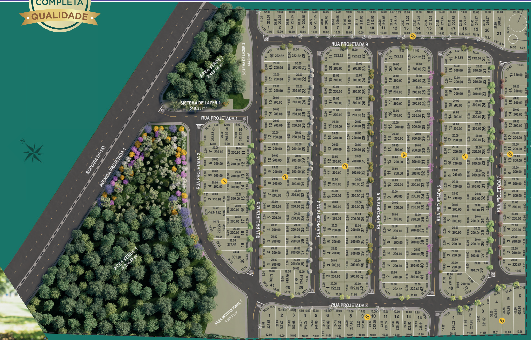
Mapa de implantação ilustrativo. Projeto sujeito a alterações.